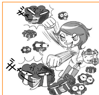
▲がん細胞を撃退するイメージイラスト

現在は、2児の母の主婦生活を生かしたマンガ&イラストと、健康をテーマにした執筆活動を行っている。