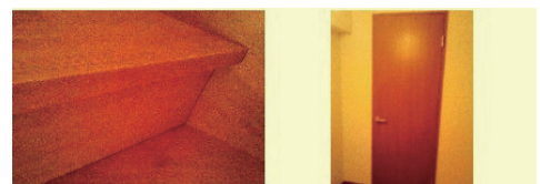
●階段と壁のスキマ ●欠陥住宅名物の勝手に閉まる扉