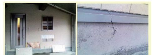
●断熱不良材が見える壁 ●良くないひび割れを再現