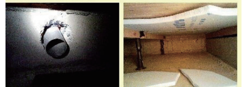
●基礎の鉄筋を貫通した配管 ●床下の断熱材不良